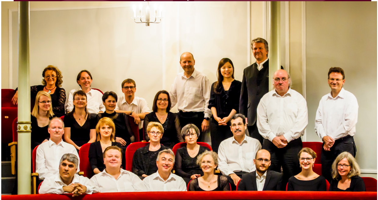
Lux Festspielverein e.V., Marienstraße 1, 99842 Ruhla, Deutschland. info@lux-festspiele.de.